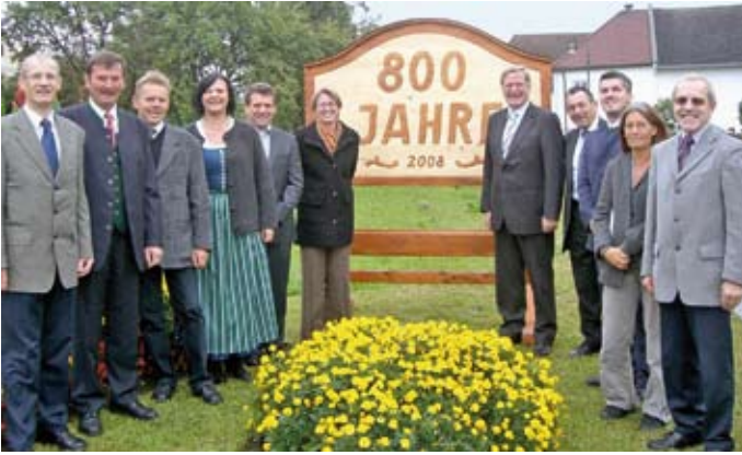
800 Jahre Kleinschönau (21. September 2008)