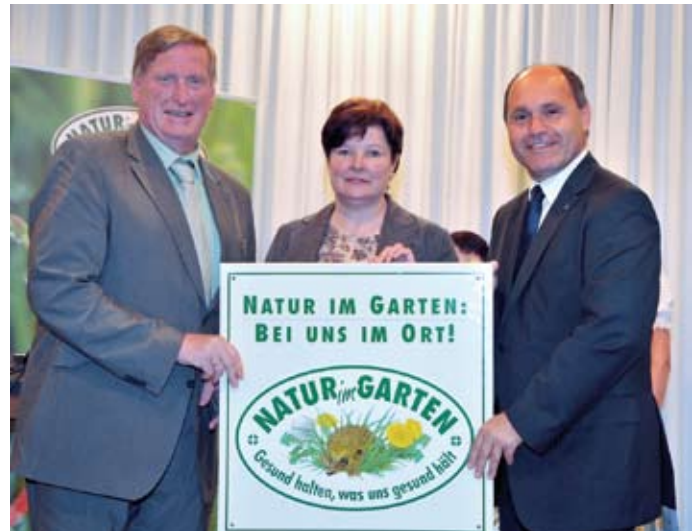
Im Rahmen des großen „Naturgartenfestes“, das am 20. und 21. Juni 2009 auf Schloss Schallaburg stattfand, wurde die Stadtgemeinde mit der „Natur im Garten“-Plakette ausgezeichnet.