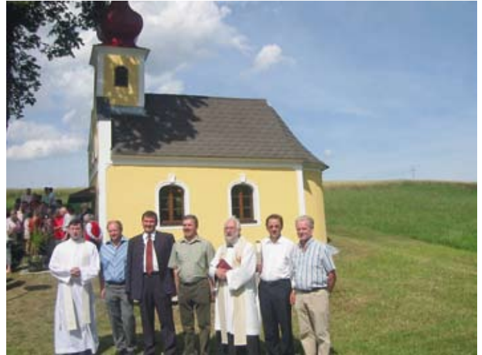
Feierliche Eröffnung der renovierten Ortskapelle Bösenneunzen (2007)

Die Gemeinde leistet weiters einen Beitrag zur Sanierung des Zisterzienserstiftes Zwettl und zur Erhaltung der Pfarrkirchen, so z. B. auch zur 2008 abgeschlossenen Renovierung der Pfarrkirche Friedersbach und zur umfassenden Sanierung der Martinskirche und der Pfarrkirche Rieggers.