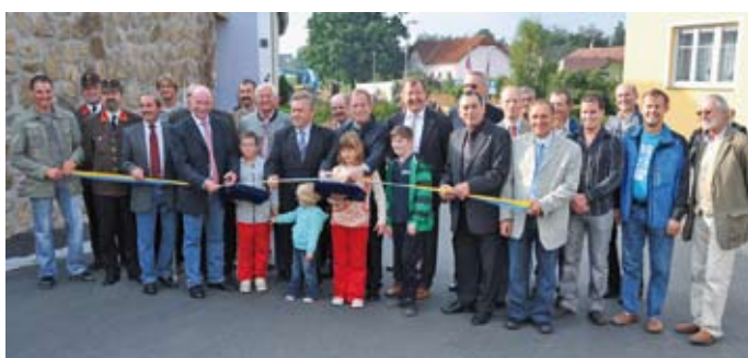
Freigabe der Ortsdurchfahrt Friedersbach