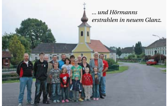
... und Hörmanns erstrahlen in neuem Glanz.