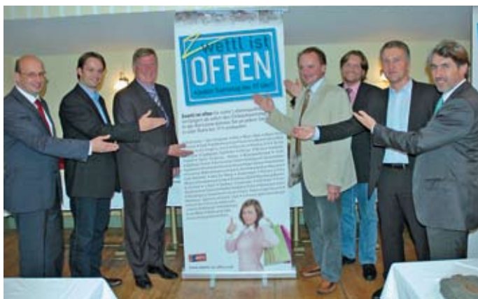
Die Stadtmarketing-Initiative „Zwettl ist offen“ wurde im Oktober 2007 gestartet.

Von der Gemeinde entsprechend unterstützt werden wirtschaftliche Initiativen wie z. B. die von der Höheren Lehranstalt für wirtschaftliche Berufe im Mai 2006 initiierte „Waldviertler Genussmesse“. Mehrere Wirtschaftsunternehmen in unserem Gemeindegebiet feierten „runde“ Bestandsjubiläen, in bester Erinnerung geblieben sind z. B. die Jubiläen „150 Jahre Bank und Sparkassen AG Waldviertel-Mitte“ (16. – 18. Juni 2006), „35 Jahre Raiffeisenbank Region Waldviertel Mitte“ (27. Mai 2006), „180 Jahre Firmengruppe Kastner“ (14. Juni 2008), „300 Jahre Zwettler Bier“ (5. - 8. Oktober 2008) und „80 Jahre Splechna Moden“ (15. – 25. Oktober 2008).