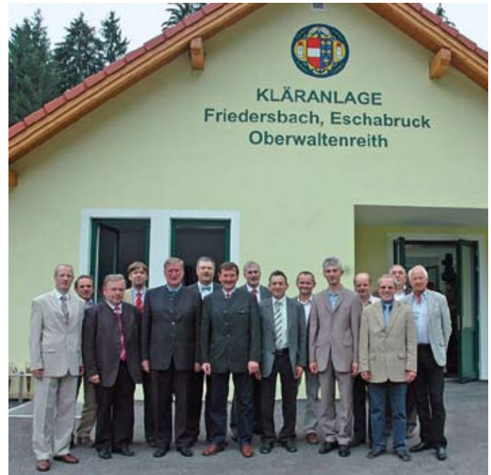
Die Kläranlage für die Katastralgemeinden Friedersbach, Eschabruck und Oberwaltenreith stand im Juli 2008 im Mittelpunkt einer Eröffnungsfeier.

Dank der im September 2009 vom Gemeinderat beschlossenen Errichtung einer Schmutzwasserkanalisation und eines Pumpwerkes können die Abwässer der KG Purken künftig in die Kläranlage Jagenbach eingeleitet und umweltgerecht entsorgt werden.