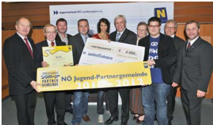
Erster Platz für Zwettl beim landesweiten Wettbewerb „NÖ Jugend-partnergemeinde 2010-2012“

Darüber hinaus gab es noch viele weitere Anerkennungserfolge z. B. in den Bereichen „Gesundheit und Soziales“, „Energie und Umwelt“, „Freizeit und Sport“ und „Wirtschaft“.