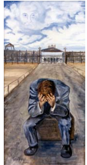
„Wieder nicht dabei“ lautet der Titel dieses Bildes von Walther Groß.

Der langjährige Berufsoffizier, der von 1969 bis 1981 die Gesamtleitung für alle Übungsplätze und Schießstätten des Bundesheeres inne hatte, möchte mit seinen Arbeiten