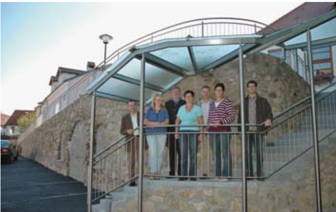
Der Aufgangsbereich zum Kindergarten Oberstrahlbach wurde neu gestaltet und mit einer Überdachung ausgestattet.

Am 6. Juli 2008 wurde das Gemeinschaftshaus Kleinmeinharts feierlich eröffnet (re.).