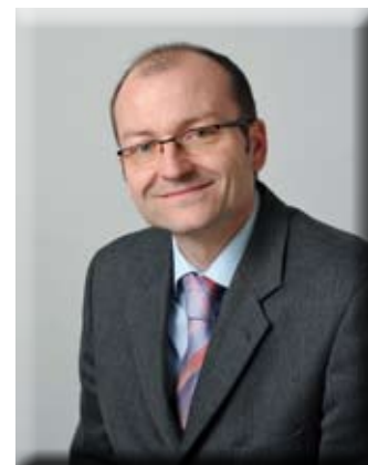
Dir. Franz Oels Redaktionsleiter

Pflege- und Betreuungsbedarf aufweisen und selbstständig den eigenen Haushalt führen können, jedoch bei Bedarf auf diverse Dienstleistungs- bzw. Betreuungs- und Pflegeangebote des angrenzenden Hauses St. Martin der Zwettler Bürgerstiftung zurückgreifen können und auch die Räumlichkeiten des Heimes nutzen können. Näheres zu diesem Projekt finden Sie auf den nachfolgenden Seiten.