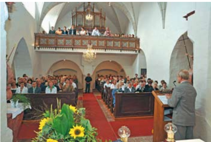
Am 7. September 2008 feierte die Friedersbacher Bevölkerung mit vielen Gästen die gelungene Innenrenovierung „ihrer“ Pfarrkirche.