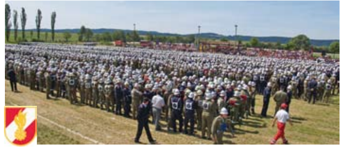
57. Feuerwehrleistungswettbewerb Edelhof (2007)