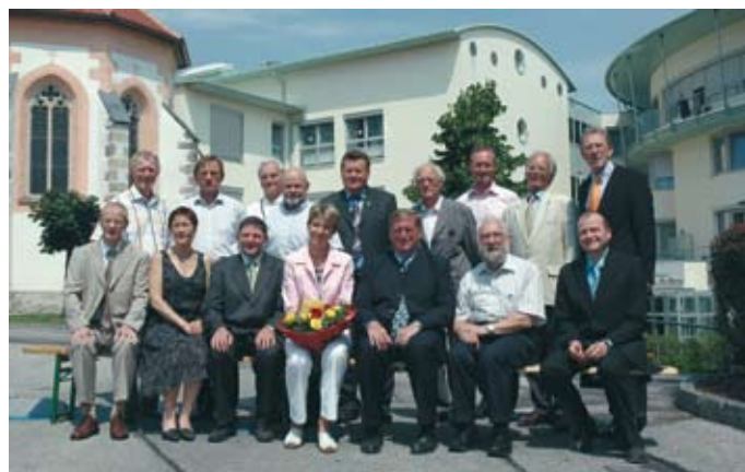
Am 22. und 23. Juli wurde die Eröffnung des in mehrjähriger Bauzeit neu gestalteten Seniorenzentrums St. Martin gefeiert.