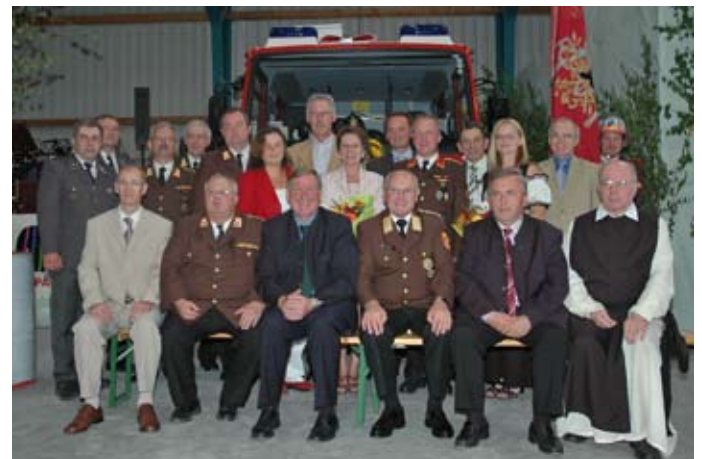
125 Jahre FF Rudmanns (2008)

Neben zahlreichen Wettkampf- und Ausbildungserfolgen gab es auch ein besonderes Großereignis, nämlich den 57. Feuerwehrleistungswettbewerb, der vom 29. Juni bis 1. Juli 2007 in Edelhof ausgetragen wurde und an dem mehrere tausend Feuerwehrkameraden aus mehreren Ländern teilnahmen.