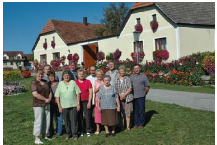
Regelmäßig mit tollen Platzierungen belohnt wurde bzw. wird auch das Blumenschmuck-Engagement der Annatsberger Ortsbevölkerung, die ihren Heimatort jährlich mit viel ehrenamtlichem Einsatz zum „Erblihen“ bringt.