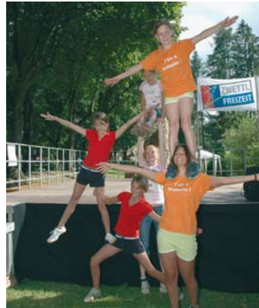
Bildimpression vom Sommerferienspiel 2007.

Eine besonders renommierte Veranstaltungsreihe ist das „Internationale Orgelfest Stift Zwettl“, das sich 2008 mit einem hochkarätigen 25-Jahr-Jubiläumsprogramm in eine - voraussichtlich bis zum Ende der Stiftskirchenrenovierung befristete - Pause verabschiedete. An seine Stelle trat 2009 die Konzertreihe „Musik in der Bibliothek“.