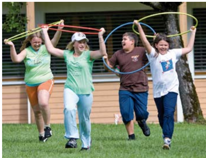
So macht Abnehmen Spaß: Das Gesundheitsprogramm „Durch dick und dünn“ wurde speziell für Kinder und Jugendliche entwickelt.

Weitere Infos zum Programm finden Sie in der Broschüre „Durch dick und dünn“