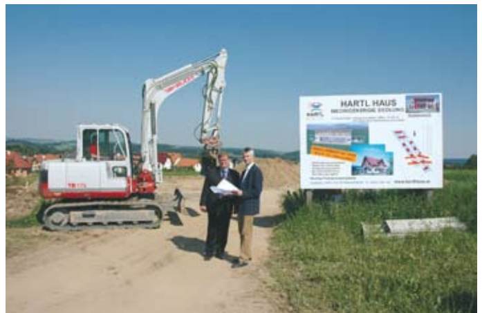
In Rudmanns wurde ab 2006 ein neues Siedlungsgebiet erschlossen.

Mit der Durchführung entsprechender Aufschließungsmaßnahmen unterstützt die Gemeinde die Entstehung neuer bzw. die Erweiterung bestehender Siedlungsgebiete. Beispielfhaft zu nennen wären das 2006 begonnene Hartl Haus-Wohnprojekt in Rudmanns sowie die Aufschließung von Baugründen in den