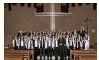
Musik für einen guten Zweck: Der Wiener Gospelchor „Gospelpower“

Die Ausstellung kann von 8. bis 28. April 2010 während der Arbeitsstunden (Mo. bis Fr. von 8.00 bis 12.00 Uhr und Mo. bis Do. von 13.00 bis 15.00 Uhr) besichtigt werden. Zur Vernissage, die am 7. April um 19.30 stattfindet, sind alle Interessierten herzlich eingeladen!