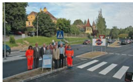
Die in Etappen durchgeführte Umgestaltung des Zwettler Busbahnhofes wurde 2008 abgeschlossen.