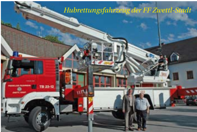
Hubrettungsfahrzeug der FF Zwettl-Stadt