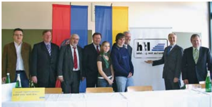
Am 24. Jänner 2008 wurde das neue HTL-Ausbildungsangebot der Öffentlichkeit vorgestellt.

Ein nächster Schritt war die Einführung der Ausbildungskombination „Business & Care“, die seit dem Schuljahr 2009/10 an der Handelsschule angeboten wird.