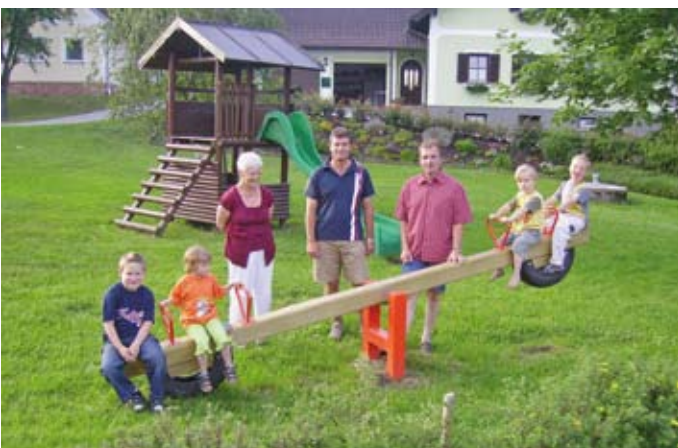
Die Spielplätze in der Gemeinde werden von vielen Kindern genutzt, hier ein Bildbeispiel aus Gradnitz.

In den vergangenen Jahren wurden zahlreiche Maßnahmen zur Attraktivierung des ZwettlBades durchgeführt: Neben der Einführung neuer Angebote – vom Baby- und Kleinkinderschwim-