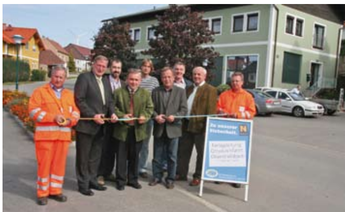
Am 29. September 2008 wurde die auf einer Länge von 2,5 Kilometern erneuerte Ortsdurchfahrt von Oberstrahlbach offiziell für den Verkehr frei gegeben.