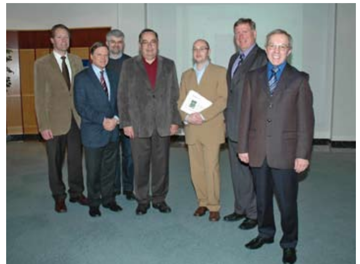
10 Jahre Zwettler Zeitzeichen: Am 27. November 2009 wurde der Band „Jüdisches Leben in Zwettl“ präsentiert.