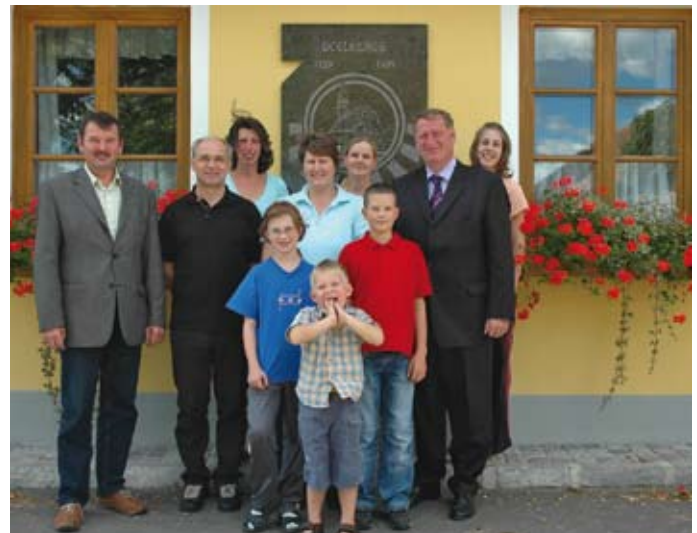
Niederstrahlbach erreichte 2006 einen ersten Platz beim Wettbewerb „Blühendes Niederösterreich“ und wurde 2007 zur „schönsten Kleinstgemeinde“ des Waldviertels gekürt.