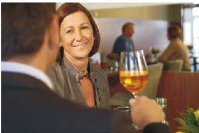
WINWIN - der Treffpunkt in Zwettl - eine Cafébar mit trendiger Architektur, Atmosphäre, Spitzenweinen und einem umfassenden und transparenten Glücksspielangebot.

TRAVESTIE & PARODIE mit Sascha am 29.4., ab 20 Uhr.