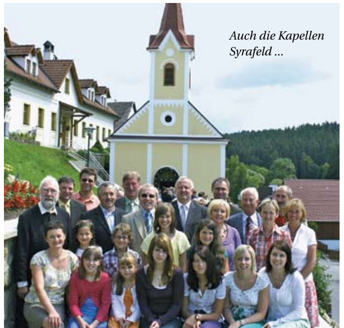
Auch die Kapellen Syrafeld ...