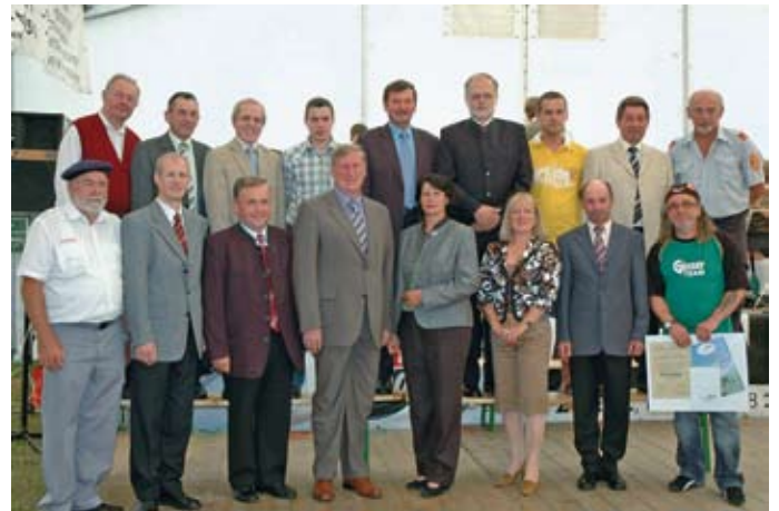
800 Jahre Jagenbach (8. - 10. August 2008)