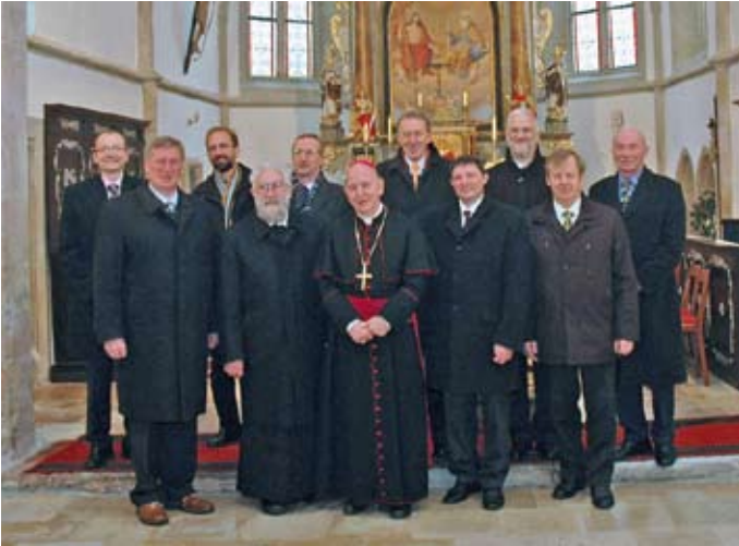
Die umfassend sanierte Martinskirche wurde am 11. November 2007 im Beisein von Diözesanbischof DDr. Klaus Küng feierlich wiedereröffnet.