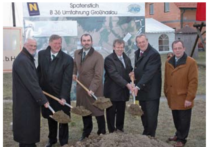
Am 25. Februar 2008 erfolgte der Spatenstich zur Errichtung der Umfahrung Großhaslau – mittlerweile ist dieses Vorhaben bereits weit fortgeschritten.