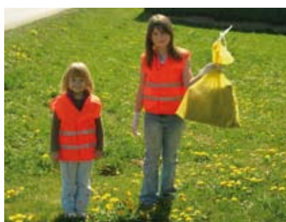
An der jährlich durchgeführten Flurreinigungsaktion nehmen auch regelmäßig viele Kinder teil, hier zwei fleißige Helferinnen aus Gerotten.