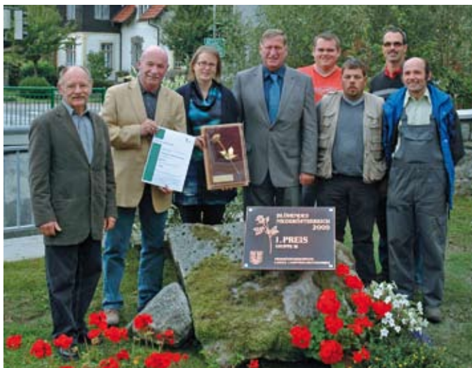
2008 erreichte Zwettl beim Wettbewerb „Blühendes Niederösterreich“ den 2. Platz. Im darauffolgenden Jahr wurde die blumengeschmückte Brau- und Kuenringerstadt zum Landessieger gekürt.