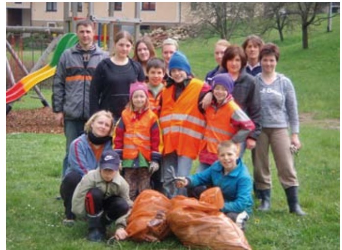
Auch in Unterrabenthan (oben) und Kleinotten (unten) wird jedes Jahr fleißig Müll gesammelt, wie diese Beispielfotos aus den Jahren 2008 bzw. 2009 zeigen.