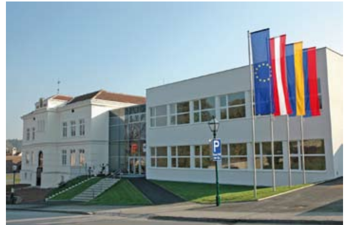
Gelungene Verbindung von Alt und Neu: Die generalsanierte Hauptschule Stift Zwetl wurde am 17. Oktober 2007 feierlich eröffnet.

In weiterer Folge war es möglich, die Musikschule Zwetl 2006 von ihrem früheren Standort in der Landstraße in das „rund-