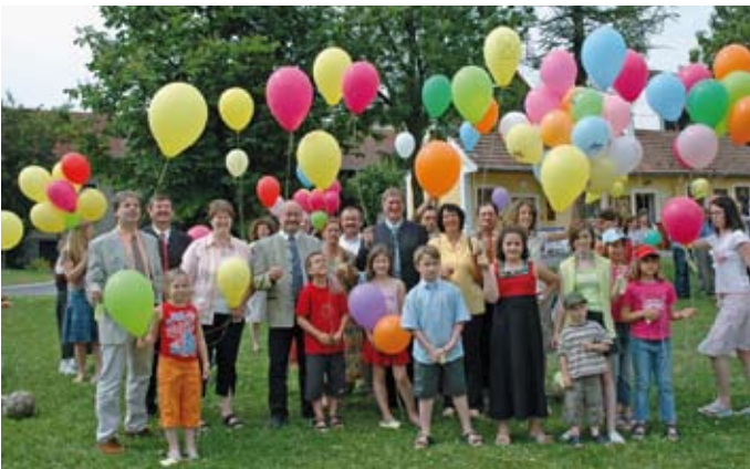
Der 17. Juni 2006 stand ganz im Zeichen des Jubiläums „20 Jahre Dorferneuerung Niederstrahlbach“.