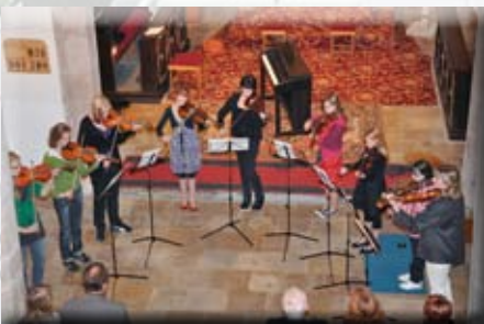
Konzert der Musikschule Zwettl in der Martinskirche