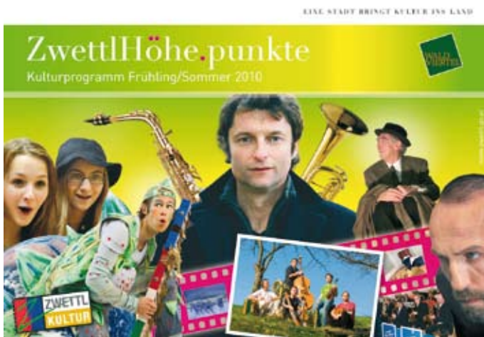
Titelseite der neu erschienenen Broschüre ZwettlHöhepunkte - Frühling/Sommer 2010