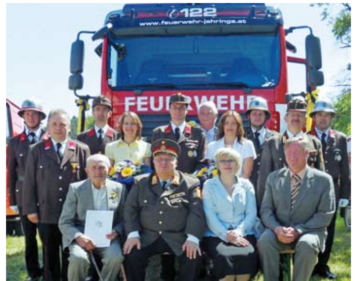
Fahrzeugsegnung bei der FF Jahrings (14. Juni 2009)