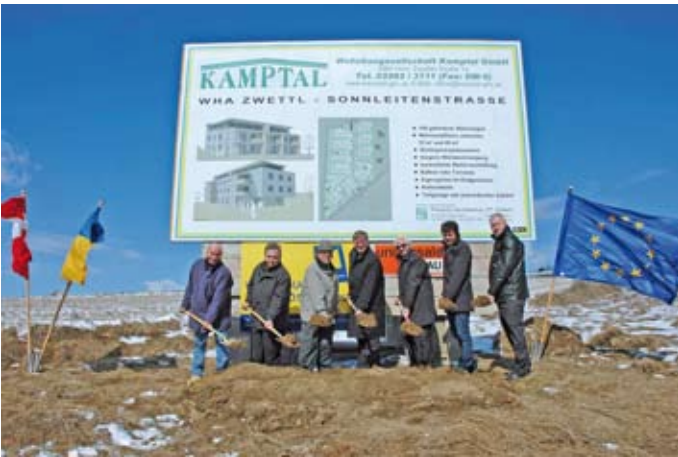
Am 25. März erfolgte der Spatenstich zur Errichtung der Wohnhausanlage Hammerleiten.

Katastralgemeinden Eschabruck, Rieggers, Kleinschönau und Waldhams.