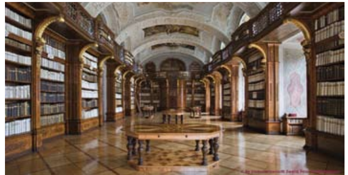
Wird zum Konzertsaal: Bibliothek des Stiftes Zwettl

Ein besonders interessantes Kapitel sind die sogenannten „Ziegelzeichen“, die zur Kennzeichnung der Ziegel verwendet wurden und die im Stadtmuseum mittels historischer Originalziegel dokumentiert und erläutert werden. Zur anschaulichen Gestaltung der Sonderausstellung tragen heuer auch Schüler und Lehrer der Polytechnischen Schule Zwettl bei, die eigens für diesen Zweck einen gemauerten Ziegelbogen und einen „Ziegelschlagtisch“ anfertigten. Letzterer wird bei der Ausstellung verwendet. Ausstellungseröffnung: 1. Mai 2010 (Beginn: 10.00 Uhr)