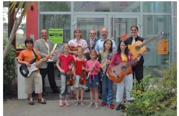
Der Musikschulunterricht findet seit dem Schuljahr 2006/2007 am neuen Standort in der Schulgasse 24 statt.