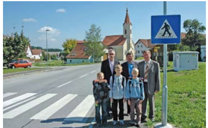
Sicherheit hat Vorrang: In Großhaslau wurde 2007 ein neuer Schutzweg errichtet ...