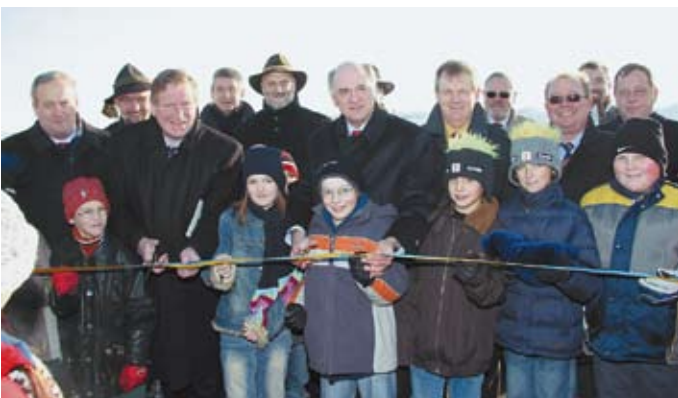
Am 1. Dezember 2005 erfolgte die Eröffnung des dreispurig ausgebauten B38-Abschnittes Friedersbach-Rudmanns.