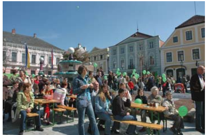
Auftaktveranstaltung zum Tourismusprojekt „Zwettl treibt's bunt“ am Zwettler Hauptplatz (8. April 2006).

Mit finanzieller Unterstützung des Landes Niederösterreich und der EU und in Zusammenarbeit mit dem Verein Wirtschafts- und Tourismusmarketing Zwettl (WTM) wurde im April 2006 das Tourismusprojekt „Zwettl treibt's bunt - eine Stadt bringt Farbe ins Land“ gestartet.