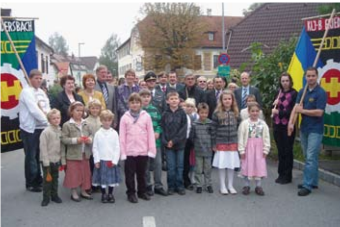
850 Jahre Pfarre Friedersbach (18. – 19. September 2009)