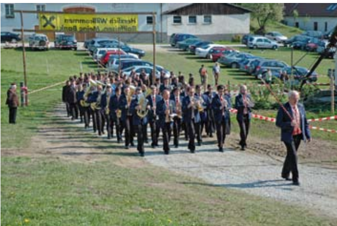
80 Jahre FF Wolfsberg (2009)