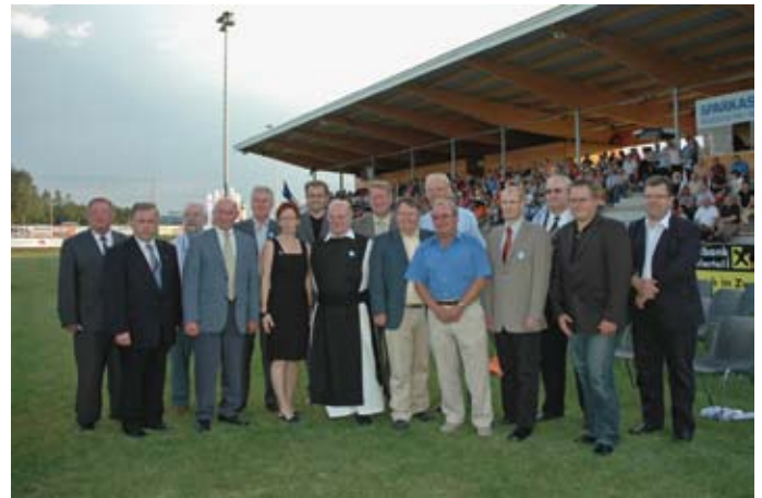
Viele Ehrengäste nahmen am 1. August 2008 an der Eröffnung der Sportanlage Edelhof teil.

men über Wassergymnastik und Volleyball bis hin zu Nordic Walking – wurde 2008 in die thermische Trennung der Schwimmbecken investiert. Diese Maßnahme macht es möglich, dass die Wassertemperaturen im Hallenbadbereich optimal an die jeweiligen Bedürfnisse der Badegäste angepasst werden können.