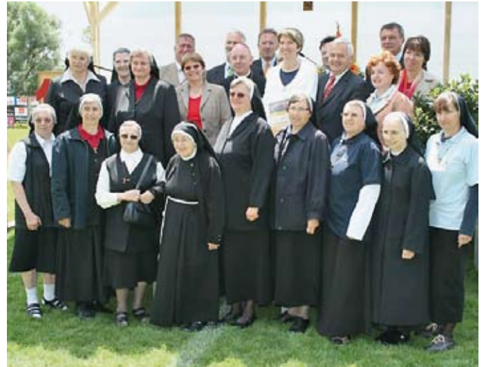
125 Jahre Schulschwestern in Zwettl (27. Juni 2007)

Mehrere Ortschaften, Institutionen, Vereine und Freiwillige Feuerwehren unserer Gemeinde feierten in den vergangenen Jahren „runde“ Bestandsjubiläen. Hier eine Auswahl (aus Platzgründen können wir leider nicht alle Anlässe anführen):