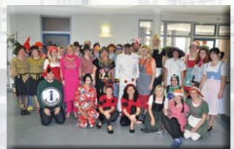
Faschingsrummel der Belegschaft im Seniorenzentrum