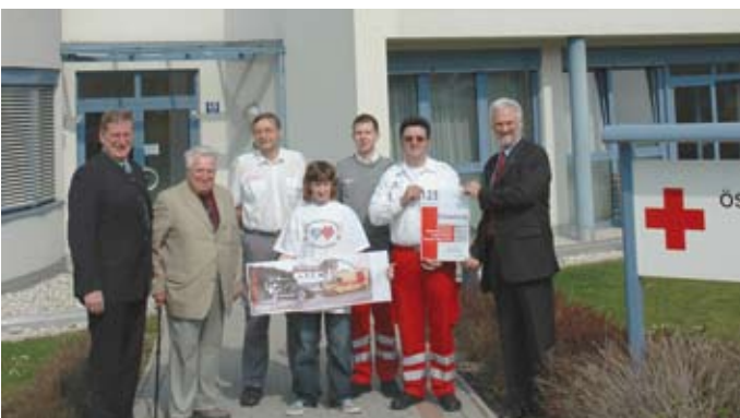
125 Jahre Rotes Kreuz Zwettl (6. Mai 2007)