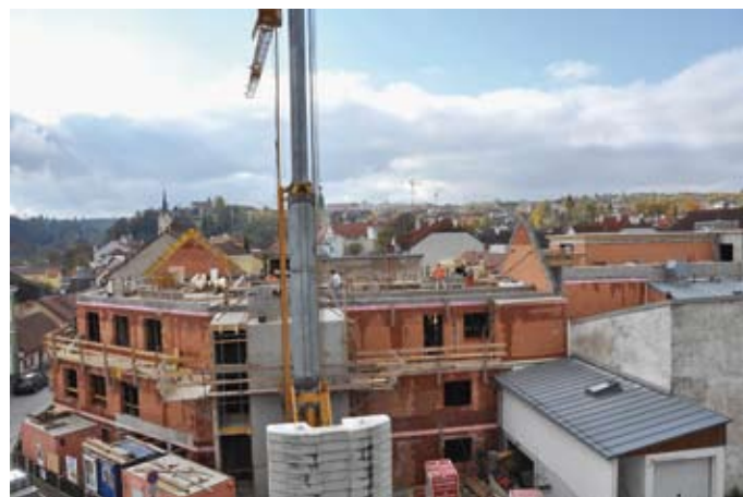
Wohnprojekt „Wohnen in Zwettl“ der Gesellschaft für ganzheitliche Förderung und Therapie – hier zu sehen auf einer Aunahme, die im November 2009 entstanden ist.

Unterstützt wurden und werden auch soziale Vorhaben wie z. B. das vom Verein „Gesellschaft für ganzheitliche Förderung und Therapie“ realisierte Wohnprojekt in der Zwettler Schulgasse und die im Herbst 2009 erfolgte Einführung eines mobilen Sozialmarktes (SOMA). Im Frühjahr 2006 wurde im Stadtamt Zwettl eine „Kidsnest“-Außenstelle des Kinderschutzzentrums Waldviertel eingerichtet, die Kindern und Jugendlichen sowie deren Angehörigen eine kostenlose fachliche Beratung bietet. 2006 wurden auch die umfangreichen Zu- und Umbaumaßnahmen beim Seniorenzentrum St. Martin erfolgreich abgeschlossen. Zu den erfreulichen Jubiläumsanlässen im sozialen Bereich gehörte das Jubiläum „25 Jahre Menschen für Menschen - 12 Jahre MfM-Arbeitskreis Zwettl“ (26. Mai 2006) und „10 Jahre Ambulatorium für ganzheitliche Förderung und Entwicklungsdiagnostik“ (7. Juni 2008).