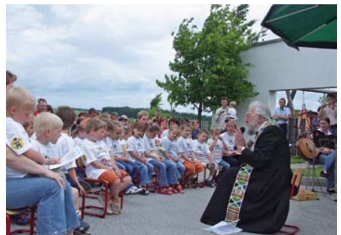
Jubiläumsfeier „10 Jahre Kindergarten Hammerweg“ (4. Juni 2005)