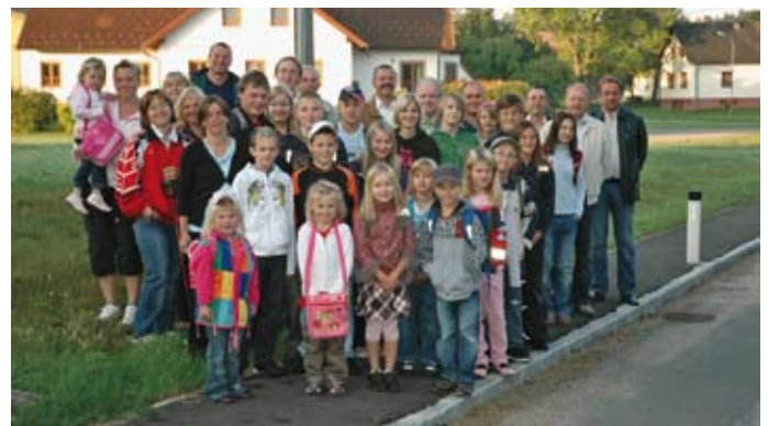
... und in Germanns benutzen die Schulkinder gerne den 2009 neu errichteten Gehsteig.