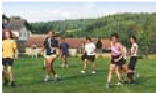
Das große Eröffnungsmatch: Frauen gegen Männer, 2002