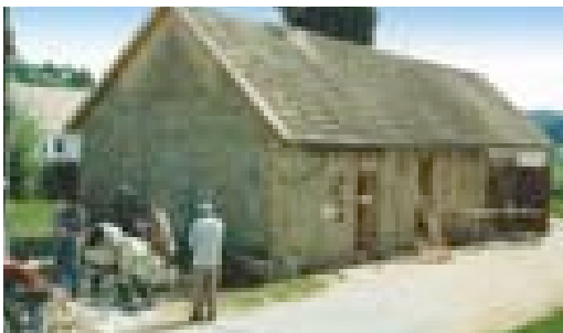
Sanierung des Gemeindehauses, 1992