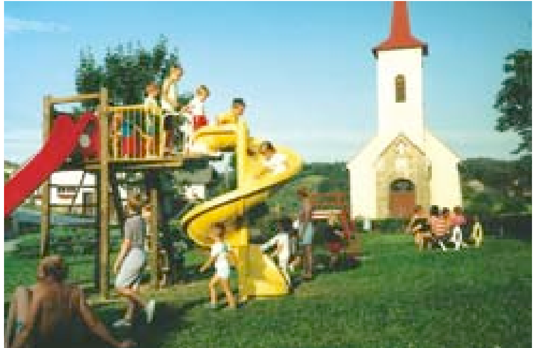
Auf dem Gschwendter Kinderspielplatz ist immer was los!

Ich finde die diversen Aktivitäten des Vereines toll! Gabi Mühlbacher , Gschwendt