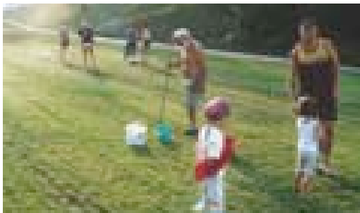
Unser Fußballplatz bekommt den letzten Schliff! 2002