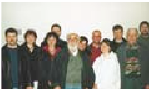
Der Vorstand, 2000

Besonderes Engagement für unsere Kinder im Ort.